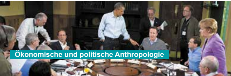
Ökonomische und politische Anthropologie