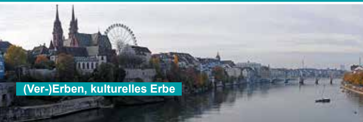
(Ver-)Erben, kulturelles Erbe